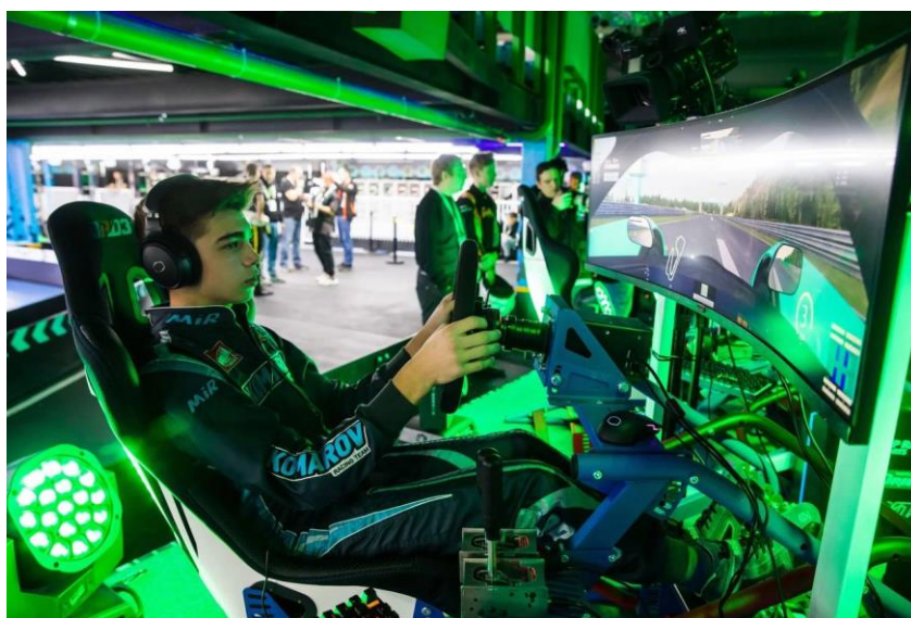
Рис. 2. Образцы фотографий для составления технического задания по фотосъемке цифрового этапа физкультурного и спортивного мероприятия по фиджитал спорту