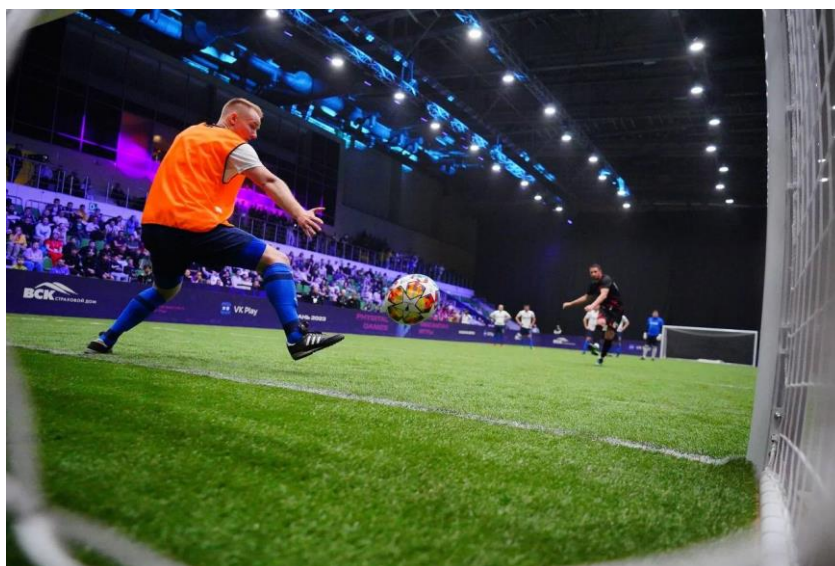
Рис. 2. Образцы фотографий для составления технического задания по фотосъемке функционального этапа физкультурного и спортивного мероприятия по фиджитал спорту